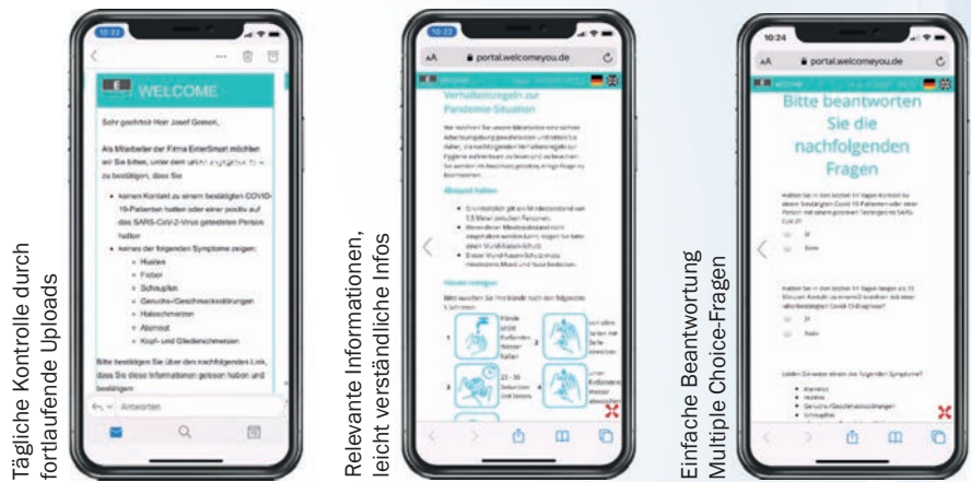
Tägliche Kontrolle durch fortlaufende Uploads

Der Mitarbeiter / Besucher erhält eine Bestätigungs-E-Mail mit einem Link zum COVID-19 Check. In der App gibt es vor Arbeits- bzw. Besuchsbeginn Hinweise zum entsprechenden Verhalten. Anschließend müssen täglich variierende Fragen zum Gesundheitszustand beantwortet werden. Wenn das Ergebnis negativ ist, wird die Freigabe zum Betreten des Firmengeländes erteilt. Bei einem positiven Bescheid wird ein Genehmigungsprozess gestartet. Die BMAS vorgabenkonforme Auswertung erhalten die autorisierten Personen in Echtzeit.